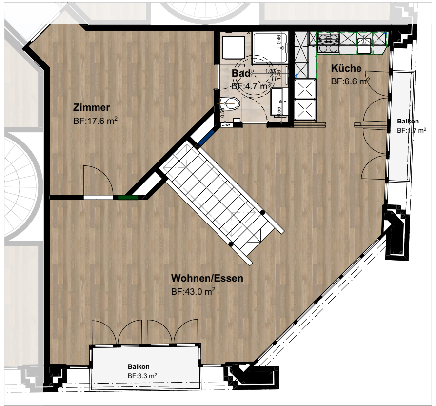
OG 4 Mst. 1:100